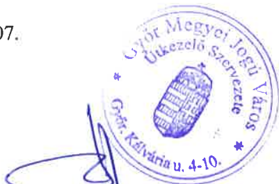
Győr Megyei Jogú Város Útkezelő Szervezete Megrendelő